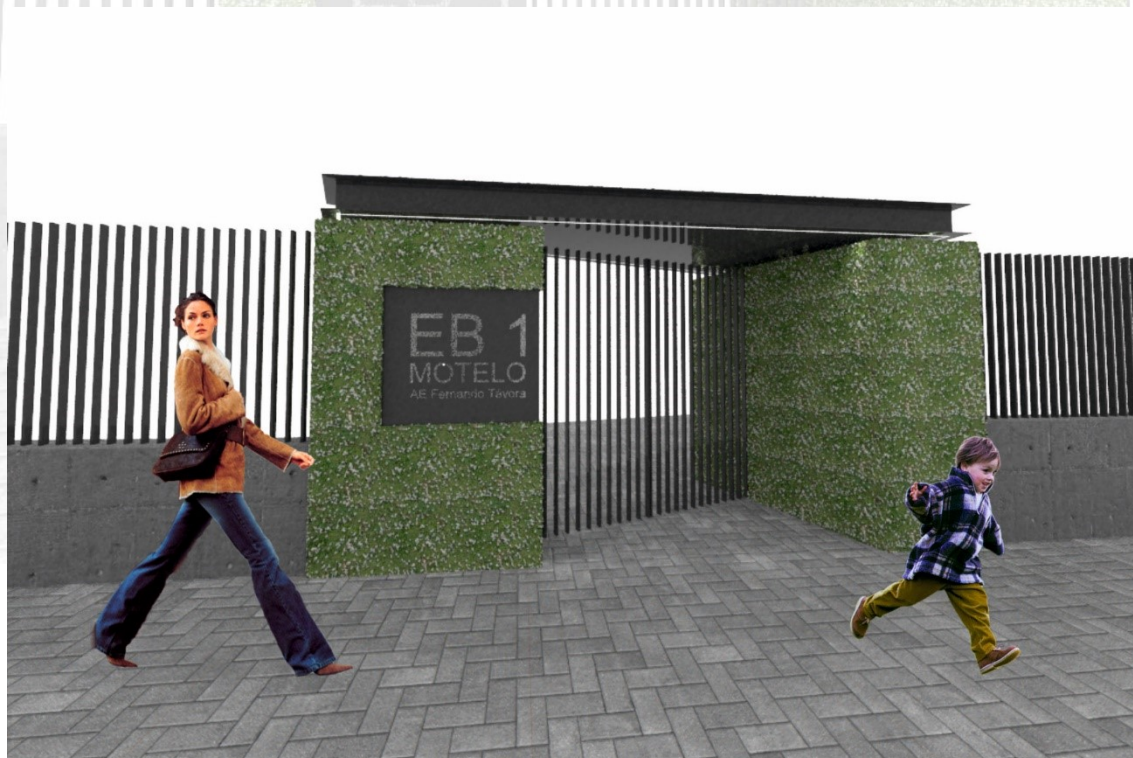
Figura 6: Imagem Tridimensional