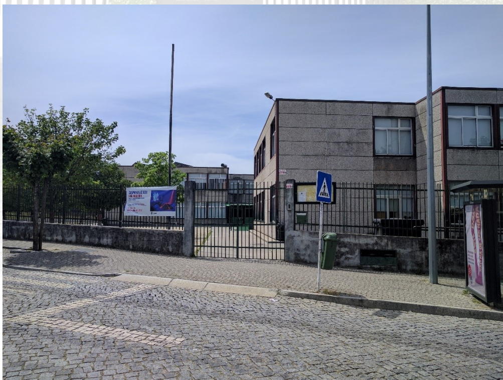
Figura 2: Fotografia entrada, Rui Mourão, maio de 2017