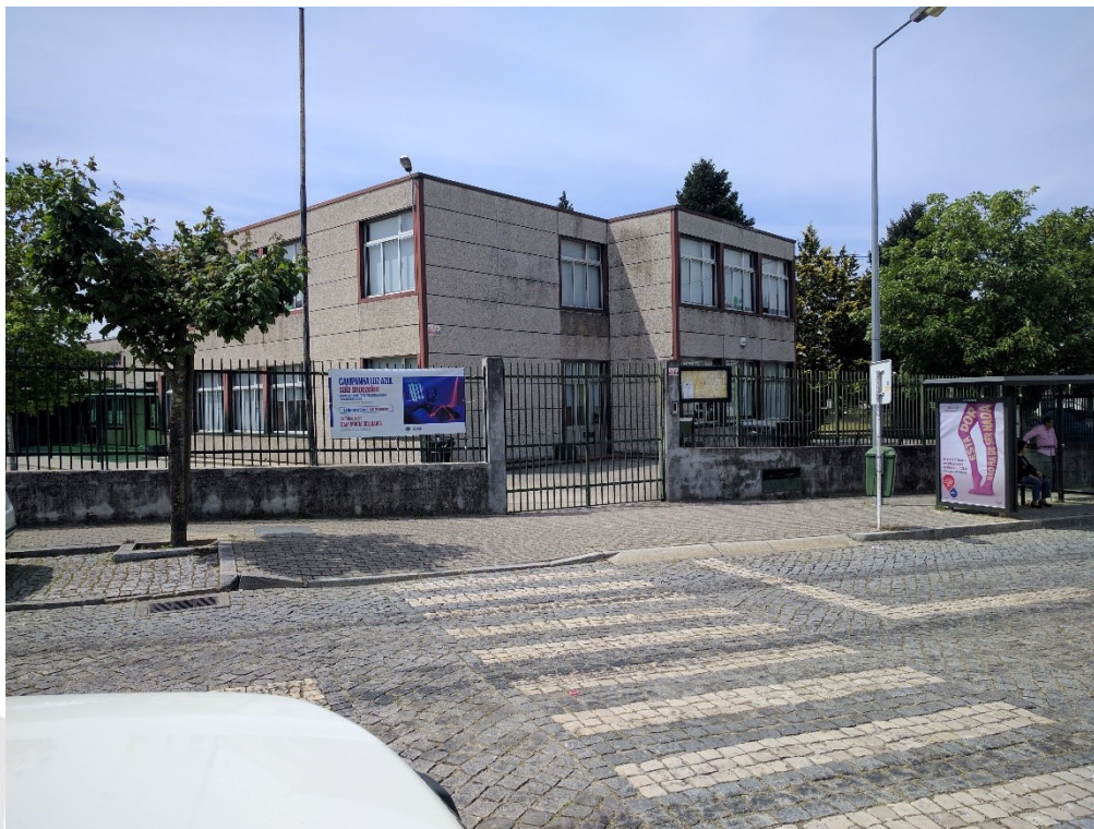
Figura 1: Fotografia entrada, Rui Mourão, maio de 2017