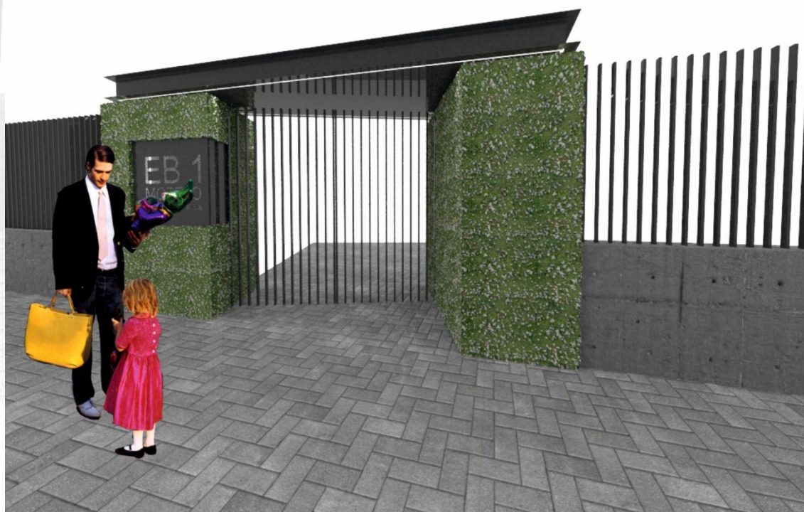
Figura 8: Imagem Tridimensional