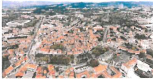
Novo Registo para Colmatação de Área

Trata-se de um plano de colmatação e urbanização de 207,70 m 2 de terreno a ser usado de forma pública, no âmbito do Projeto de Colmatação de Área para a Colmatação de Área de Colmatação de Área, no âmbito do Projeto de Colmatação de Área para a Colmatação de Área.