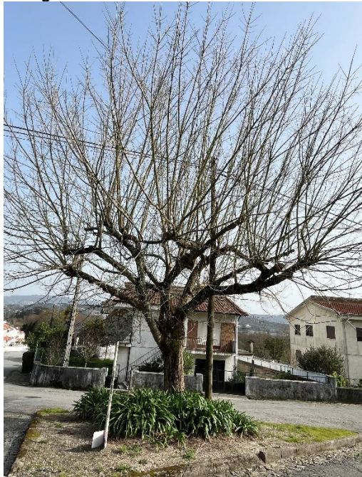
Figura 10: Enquadramento dos exemplares observados no arruamento