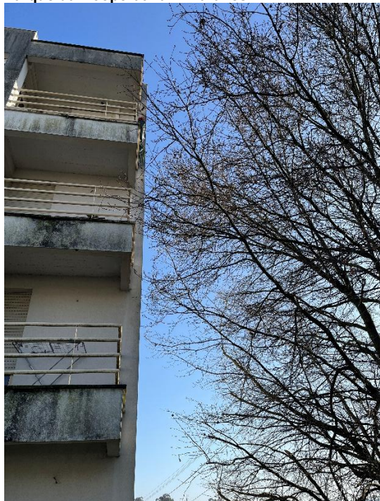
Figura 9: Enquadramento dos exemplares observados no arruamento