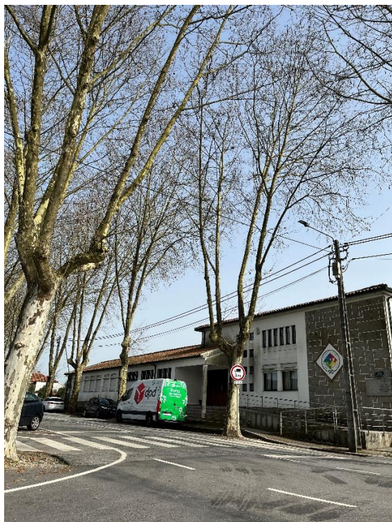
Figura 2: Enquadramento dos exemplares observados no arruamento

Avenida Monsenhor Horácio de Araújo – anotação: Igreja