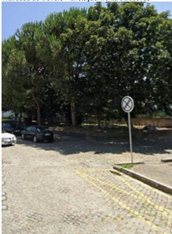
Figura 5: Enquadramento dos exemplares observados no arruamento