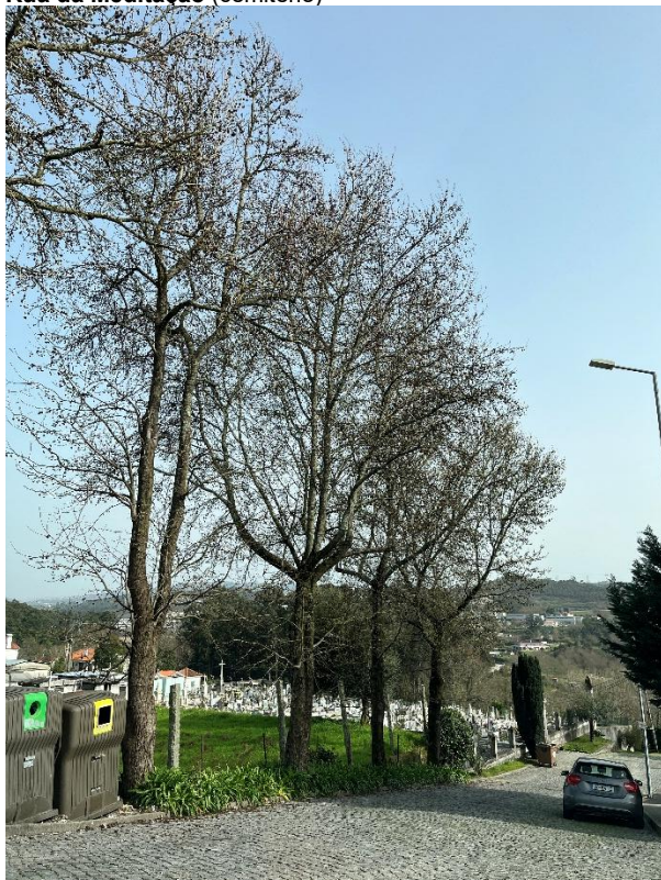
Figura 11: Enquadramento dos exemplares observados no arruamento