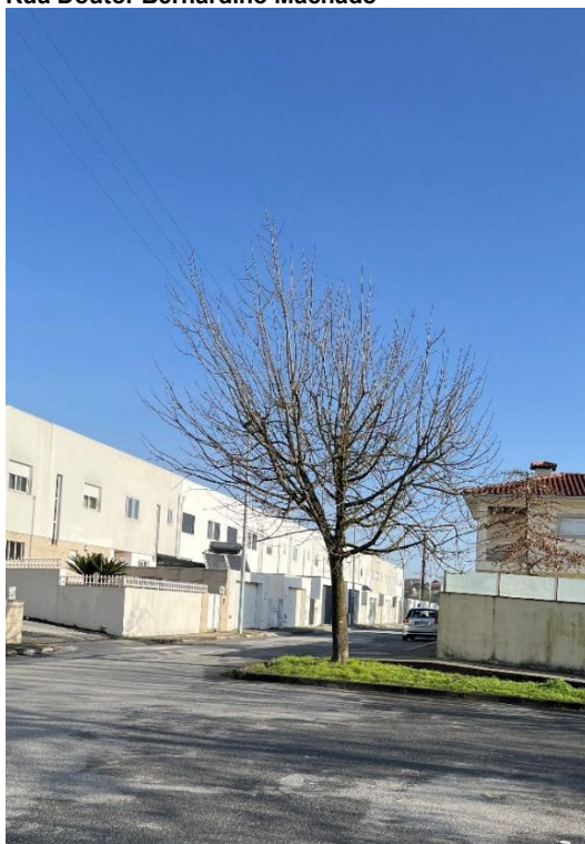
Figura 8: Enquadramento dos exemplares observados no arruamento