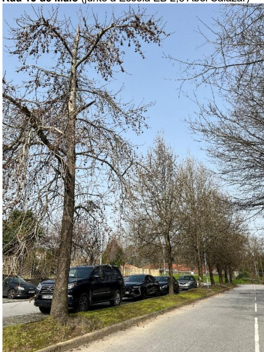
Figura 3. Enquadramento dos exemplares observados no arruamento

Rua 13 de Maio (junto à Escola EB 2,3 Abel Salazar)