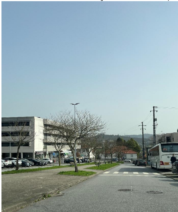
Figura 4: Enquadramento dos exemplares observados no arruamento