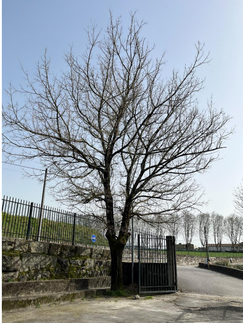
Figura 6: Enquadramento dos exemplares observados no arruamento